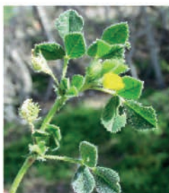
Luzernes Medicago truncatula, polymorpha, rigidula (CA07)