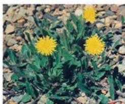
Épervière piloselle Hieracium pilosella (CA07/26/69)

Composé de 8 espèces diverses à dominante graminées