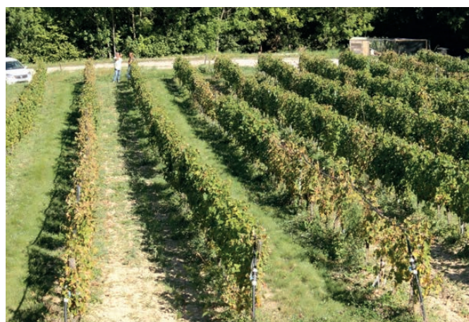
Début septembre 2015, une visite de la parcelle expérimentale permettra aux vigneronns d'apprécier les résultats de cette année.

Depuis 2013, l'installation d'une station de brumisation permet de favoriser artificiellement le développement du mildiou sur la parcelle en cas de faible pression naturelle. En 2014, un nouveau protocole d'inoculation simplifié du mildiou a été établi, rendant les expérimentations plus fiables.