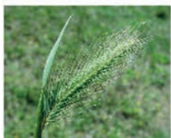
Orge des Rats Hordeum murinum (CA07/26/69)