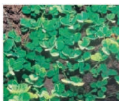
Trèfles souterrains Trifolium subterraneum (CA07/69)