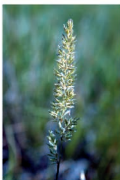
Koelerie Koeleria macrantha (CA69)