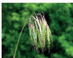
Brome des Toits : précoces et tardifs Bromus tectorum : (CA07/26/69)